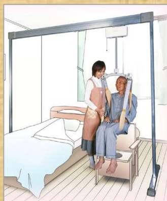
据え置き式リフト パートナー