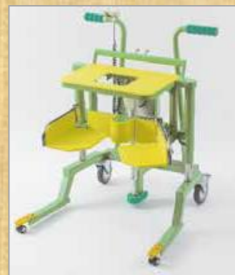
移乗用介護ロボット「移乗です」