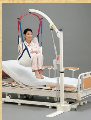
ベッド用リフト つるべーBB