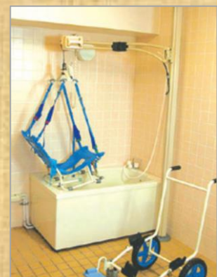
浴室用リフト マイティエースII

このほかにも、多数の福祉用具・介護ロボット関連機器を展示しています。ぜひ、ご来場ください。